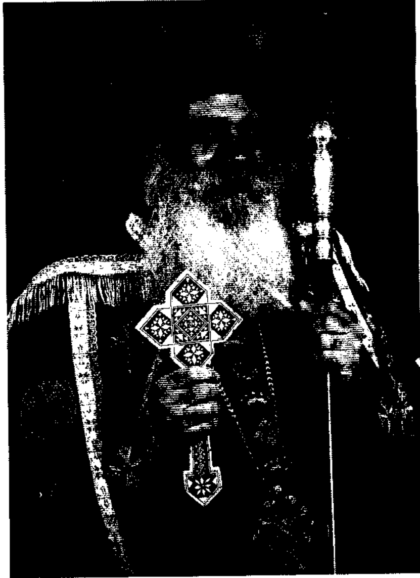
صاحب القبطة والقداصة البابا المعظم الأبنا شنودة الثالث بابا الإسكندرية وبطريك الكرازة المرقسية