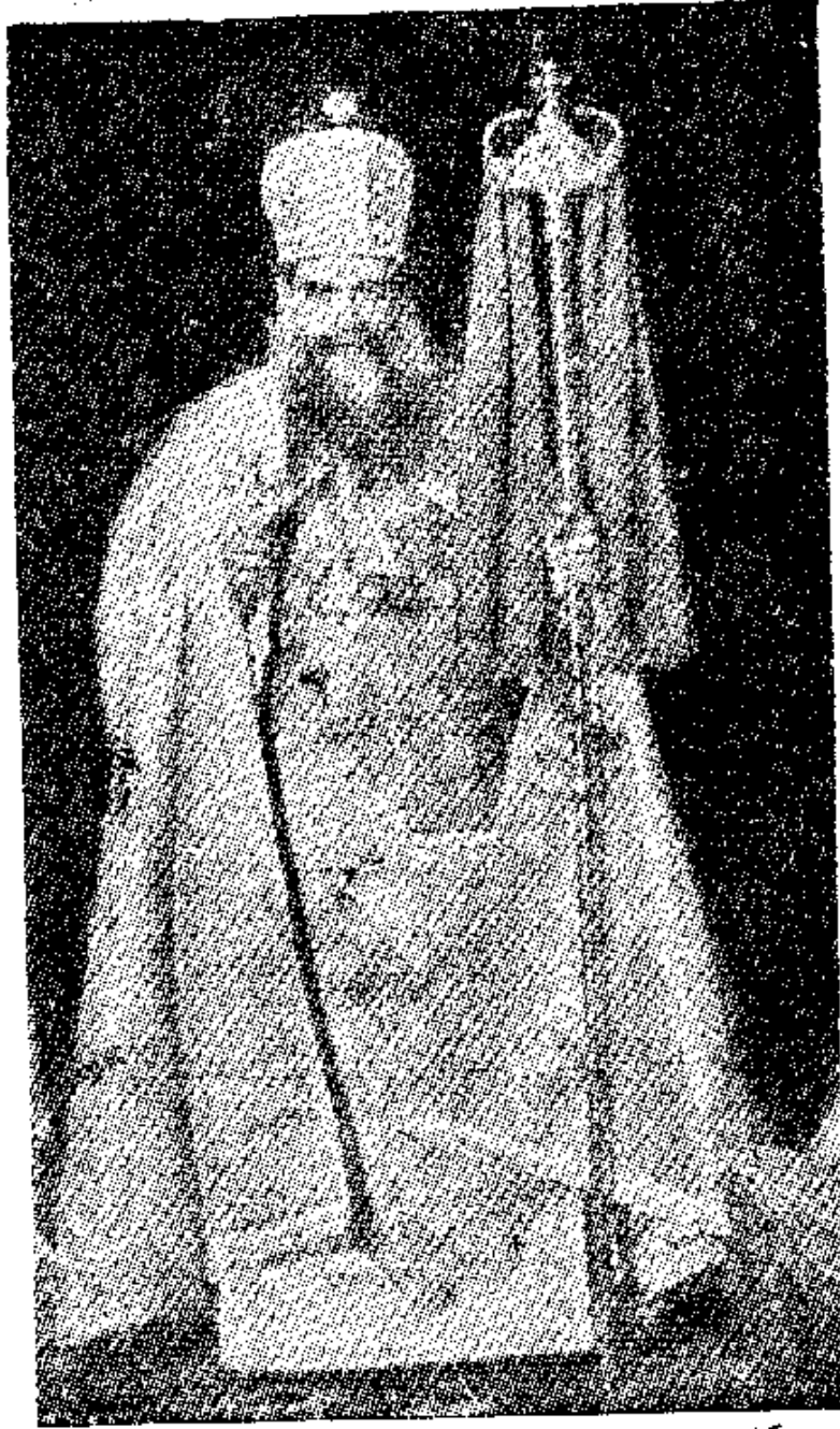
صاحب القداسة البابا كيرلس السادس بابا الاسكندرية وبطريك الكرازة المرقسية