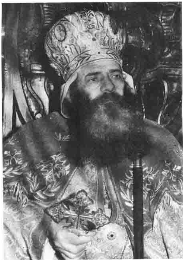
البابا شنودة الثالث